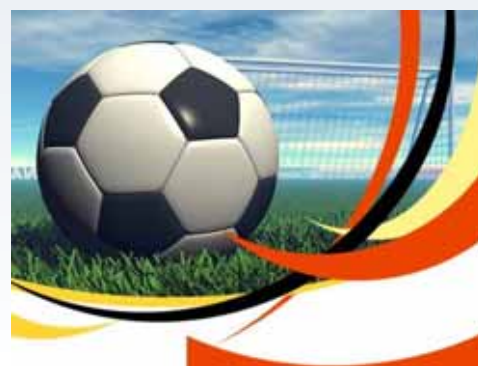
TABELA 1º FASE DO 6º CAMPEONATO DE FUTEBOL SOCIETY DO SINDICATO DAS COSTUREIRAS DE SÃO PAULO E OSASCO

Maiores informações na Secretaria de Esportes.