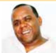
Paulo Pereira da Silva, o Paulinho, presidente da Força Sindical

Outra tarefa importante do movimento sindical será a regulamentação da terceirização, que até agora serviu basicamente para precarizar as condições de trabalho. Ficamos de elaborar uma proposta alternativa.