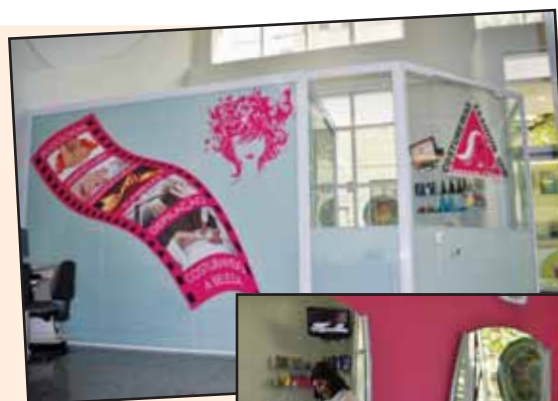
Salão de Beleza na sede do Sindicato garante os rituais de beleza das trabalhadoras