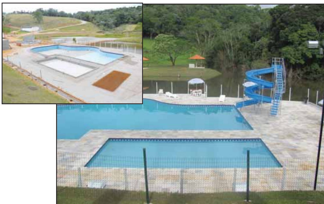
Sítio Escola durante a reforma das piscinas e a construção dos chalés

O Sindicato tem a preocupação de oferecer aos companheiros benefícios de qualidade, ambientes agradáveis e uma infraestrutura de primeira, por isso investe em cada detalhe. Confira abaixo algumas de nossas conquistas este ano: