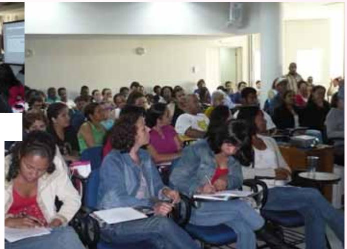
Centenas de trabalhadores participaram do seminário