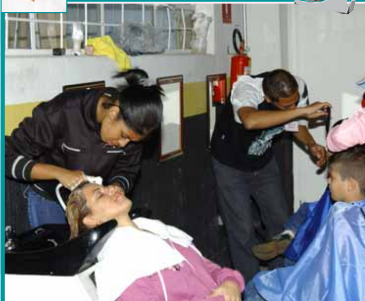
Ação cidadania no Sindicato com os colaboradores da ONG Aldeia do Futuro