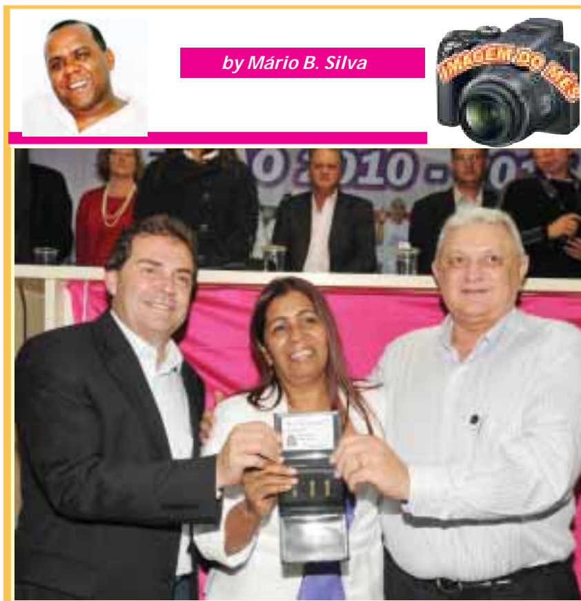
by Mário B. Silva

Presidente da Força Sindical / Deputado Federal PDT/SP