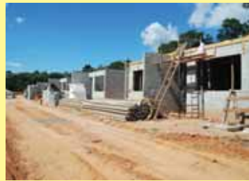
IMAGEM RECENTE DAS OBRAS 02/2010