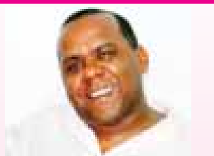
by Mário B. Silva