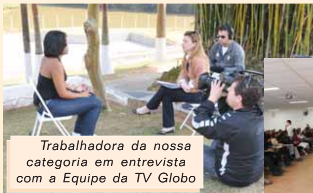
Trabalhadora da nossa categoria em entrevista com a Equipe da TV Globo